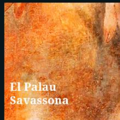
El Palau Savassona

A l'Ateneu Barcelonès li ha arribat el moment de