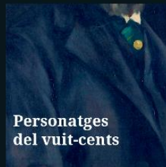
Personatges del vuit-cents